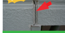
コーキングの劣化